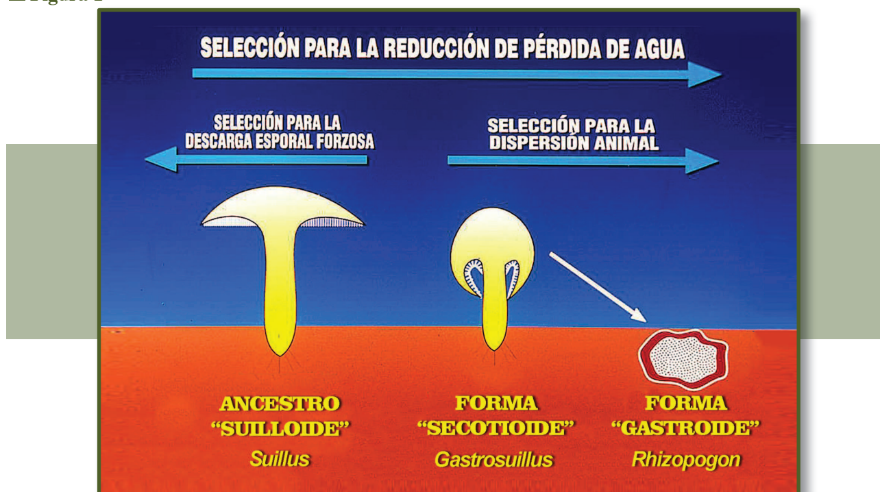
▲ Figura 1. Selección para la reducción de pérdida de agua (paso de hongos agaricoides a hongos secotioides y hongos tuberoideos o gastroides).