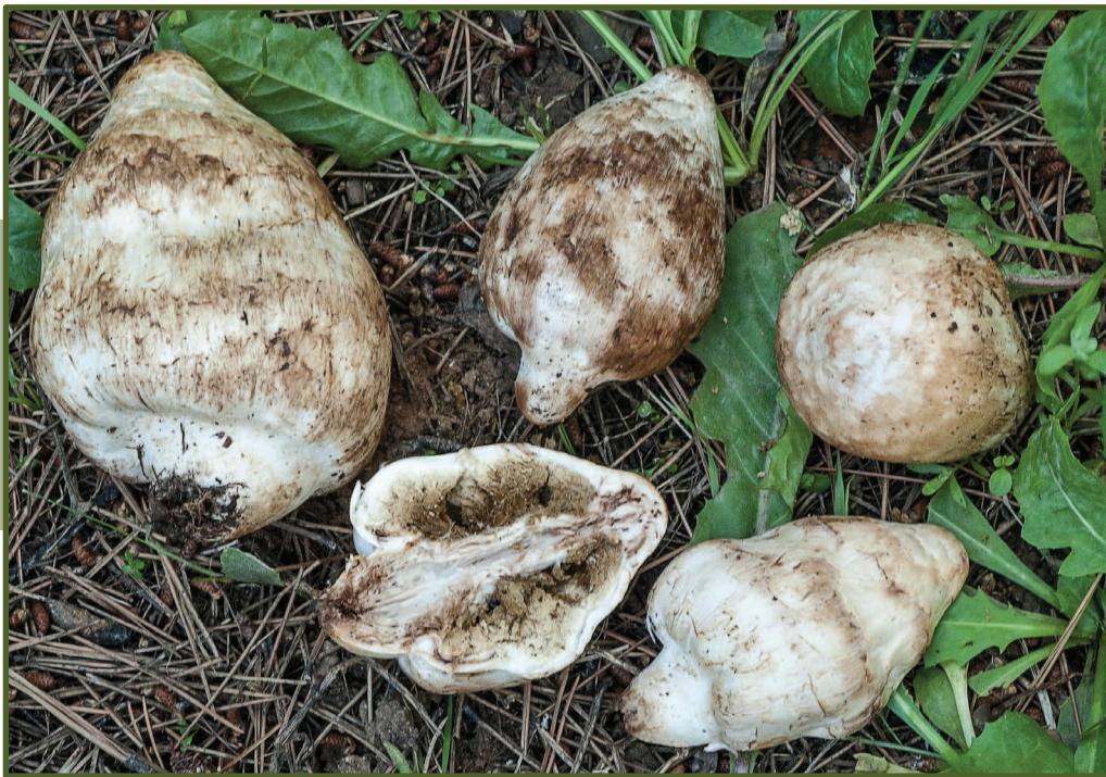
▲ Figura 2. Ejemplo de una forma secotioide mediterránea a proteger: Chlorophyllum agaricoides (Czern.) Vellinga.

2.- Los hongos psammófilos de dunas costeras son especialmente vulnerables debido a la desaparición actual de estas áreas por la influencia antrópica y la futura subida de los niveles del mar. Algunos países están incluyéndolos en sus listados de especies protegidas a nivel de interés especial. No obstante el cambio climático creará nuevos espacios costeros.